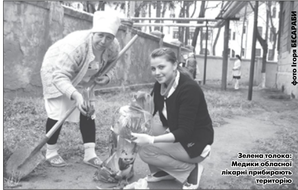
Зелена локалізація: Медики обласної лікарні прибирають територію