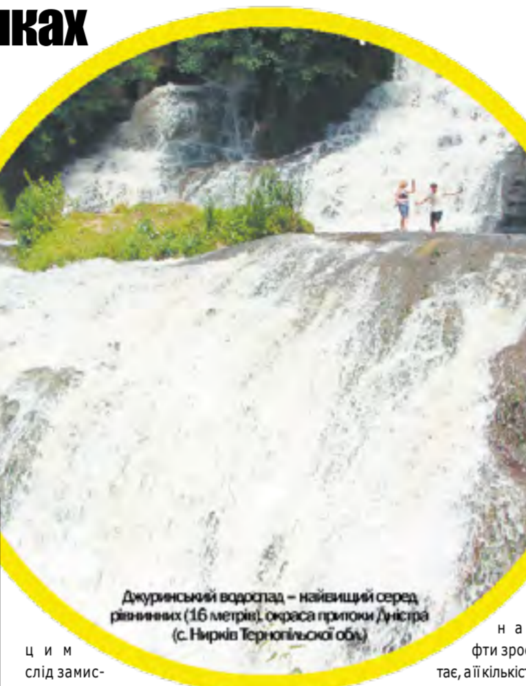
Джуринський водоспад – найвищий серед рівнинних (16 метрів), окраса прилику Дністра (с. Нирів Тернопільської обл.)

– Та, власне, з Чорнобиля. До того я писала на соціальні теми, які з часом все тісніше перепліталися з екологічними питаннями. У Швейцарії є багато проблем, пов'язаних із енергетикою. Особливо це стосується гідроелектростанцій, і найбільше тих, які «окупували» малі річки. Ці малі гідроелектростанції почали у нас будувати близько ста років тому. Мало хто знає, але щороку гідроелектростанції замулюються на 1%. Отож через століття вони вже не можуть працювати. Це стосується усіх електростанцій – й українських також. Над