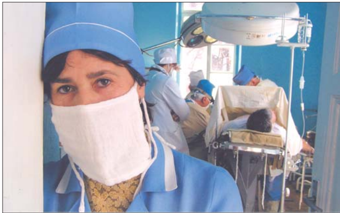
Операція... (Обласна клінічна лікарня)

Тим паче, що його талант фотомайстра вже визнала світова спільнота: цього року він став переможцем головного конкурсу FIAP – Міжнародної федерації фотомистецтва, членами якої є 85 країн з 5-ти континентів.