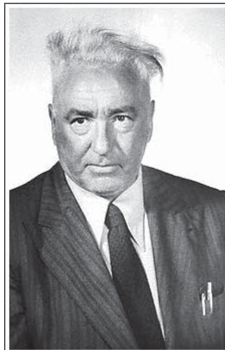
Вільгельм Райх, 1950-ті роки

Вегетотерапія Райха є базовим методом для різноманітних сучасних видів тілесноорієнтованої психотерапії (в тому числі танцювальної терапії). Ідеї Райха вплинули на і засновника гештальттерапії Ф. Перлза.