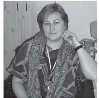
– Стереотипи треба руйнувати! Українській незалежності невдовзі 20 років, а менталітет старий, від минулих часів. Мовляв, нам винна держава чи ще хтось. Люди не навчені брати на себе відповідальність. Саме це і треба опанувати.

– «Фішка» програми «Разом ми можемо» в чому?