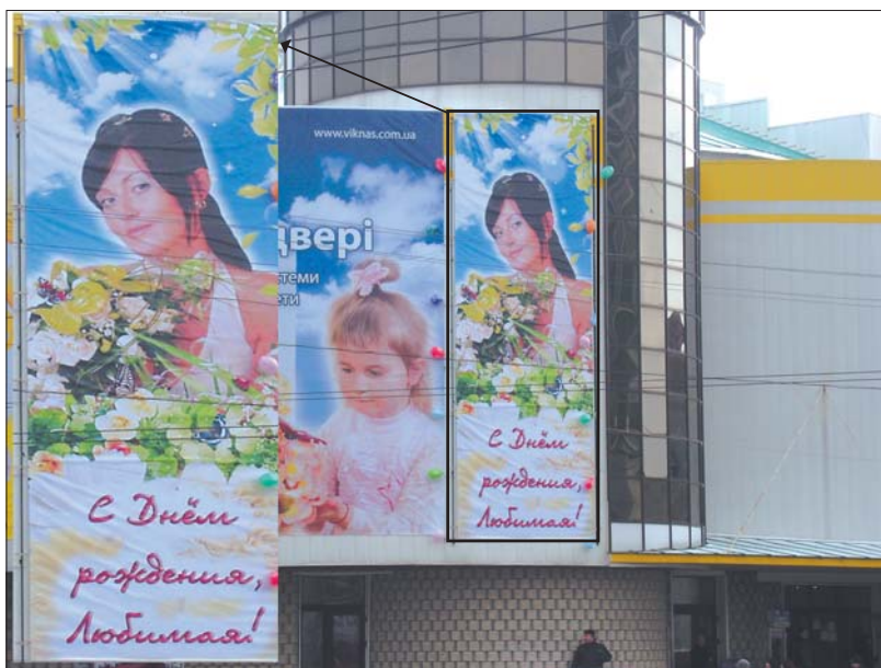
Найбільша в Україні листівка тиждень прикрашала «Формаркет»