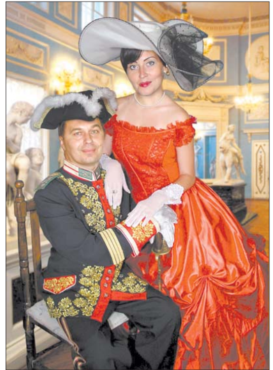
Кохання на всі часи

— Чи були зірки, які відмовилися прийти сюди? — У мене був такий випадок з «Дискотекою «Аварія». Вони сказали, що їм Чернівці нецікаві. — Чи привозили Ви когось з